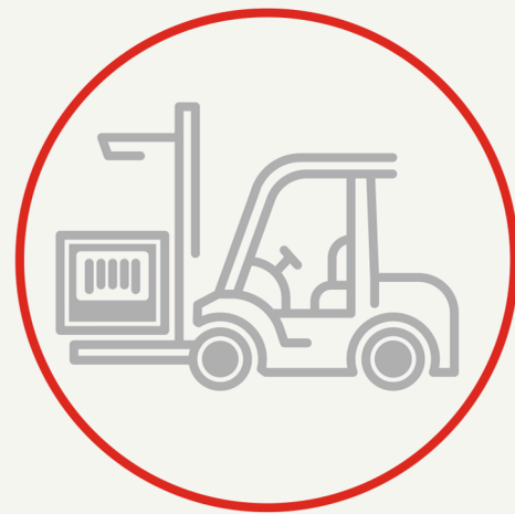
OPUS//WCS Warehouse Control