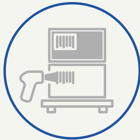
OPUS//WMS Warehouse Management