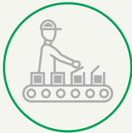
OPUS//MES Manufacturing Execution